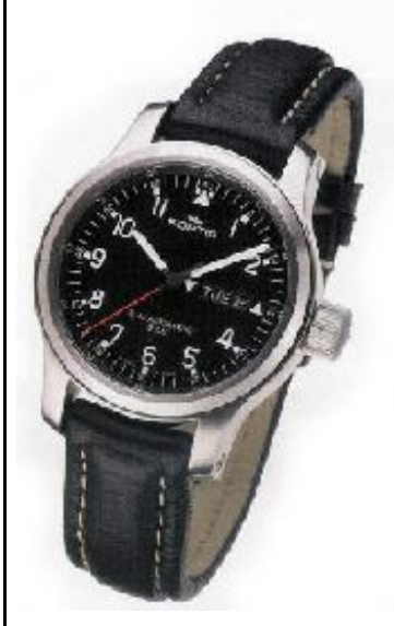
Fortis B-42 Day Date